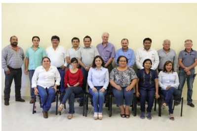
Workshop: I.T. Conkal April 11-12, 2019