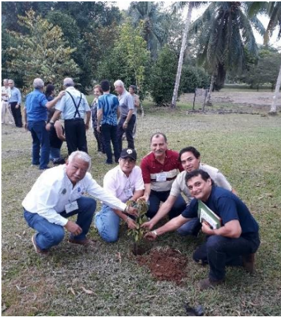
Workshop: Earth university February 4-6, 2019